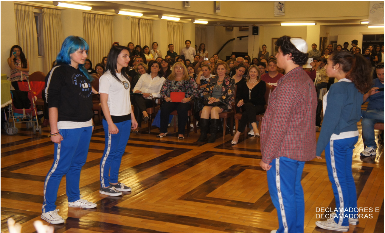
DECLAMADORES E DECLAMADORAS